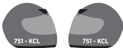
Dimensiones mínimas de letras casco