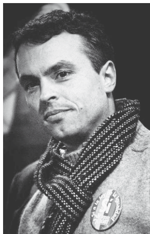
Por Esteban Paulón Presidente de la FALGBT